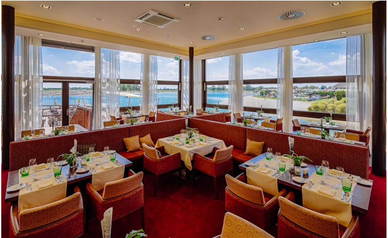
Erweiterung des Restaurants mit großzügigem Wintergarten und Terrasse über dem See.