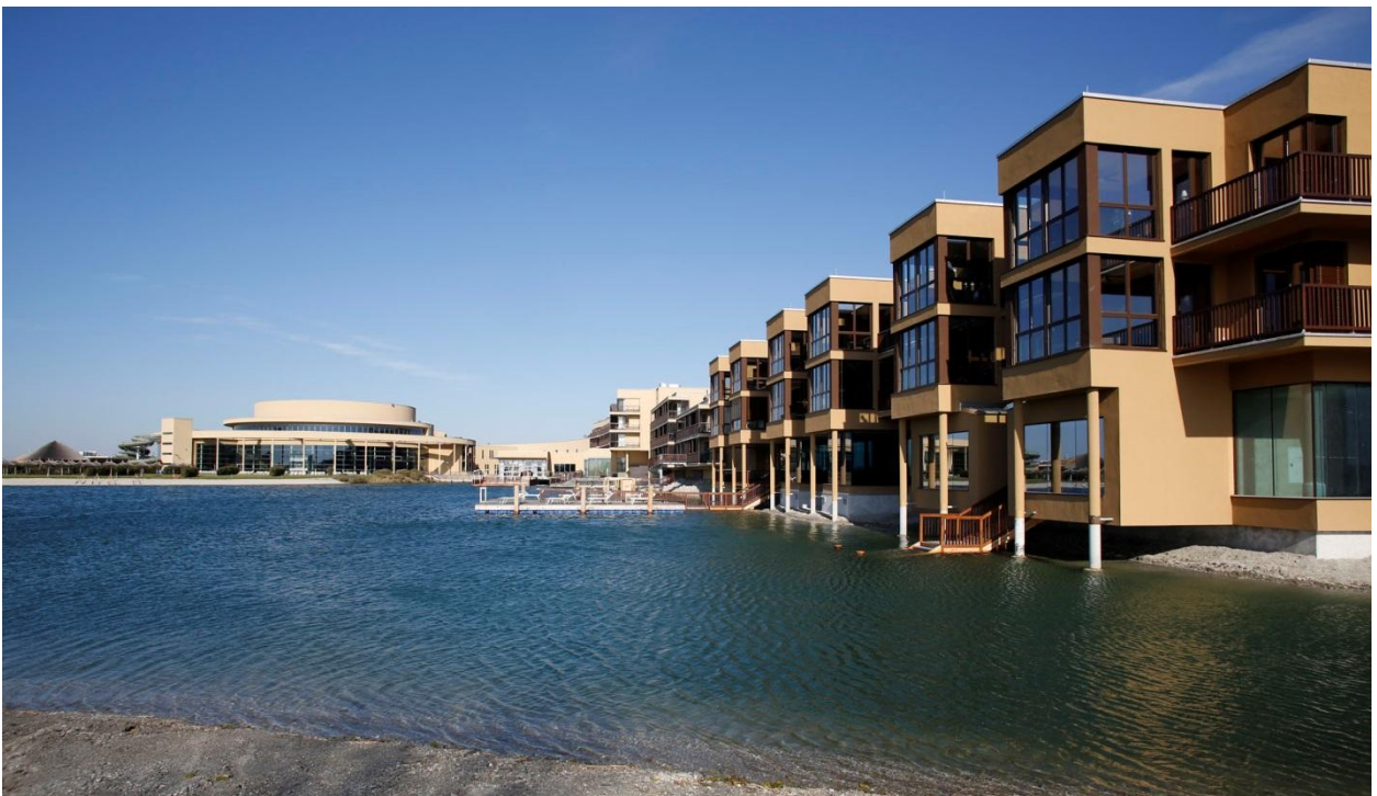
Der neue See-Trakt der St. Martins Lodge mit 28 neuen Suiten – alle mit einzigartigem Seeblick.