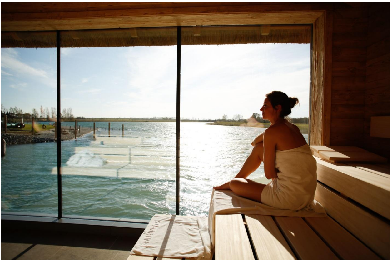
Der Blick aus der neuen See-Sauna der St. Martins Therme setzt den Seewinkel noch eindrucksvoller in Szene.