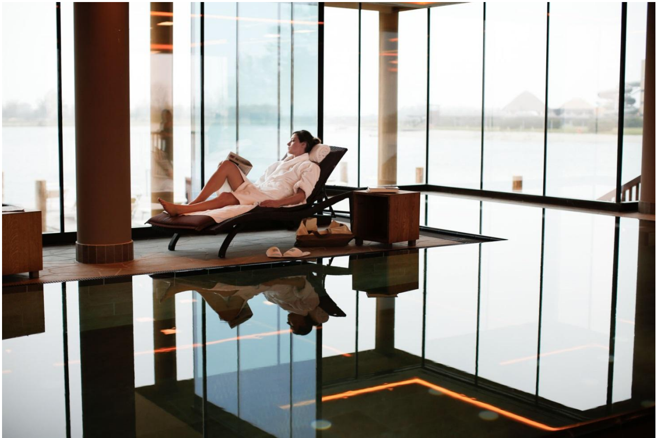
Erweiterung der St. Martins Lodge mit neuem See-SPA über dem See.