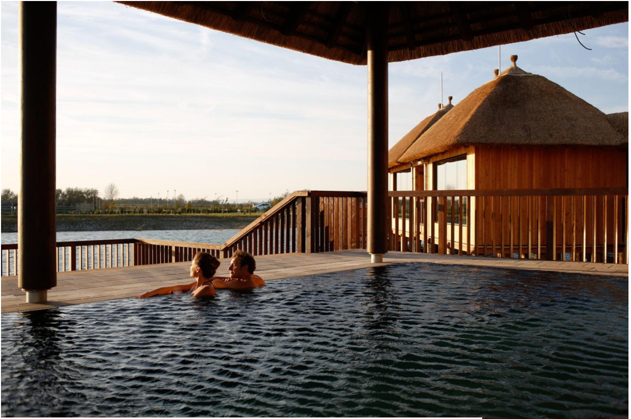
Die neue See-Sauna mit 2 finnischen Saunen, Thermalbecken und direktem Seezugang