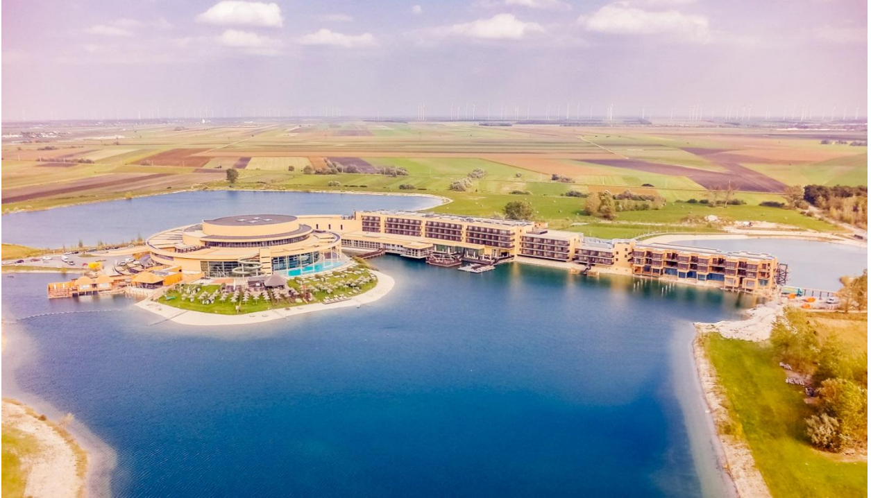
Gesamtübersicht der Erweiterungen. Im Bild der neue Lodge-Bereich, das See-Restaurant und die See-Sauna.

Credit: St. Martins Therme & Lodge. Bilder honorarfrei abdruckbar.