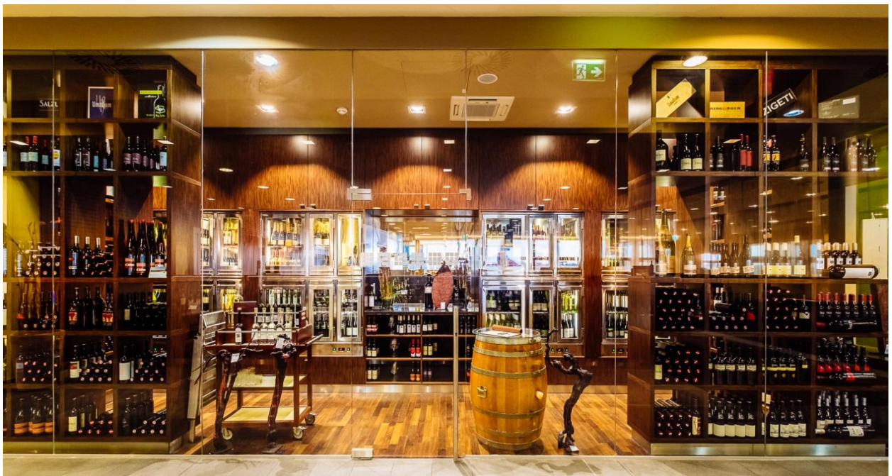
Die neue Vinothek im St. Martins Restaurant mit noch mehr Platz für Spitzenweine aus der Region.