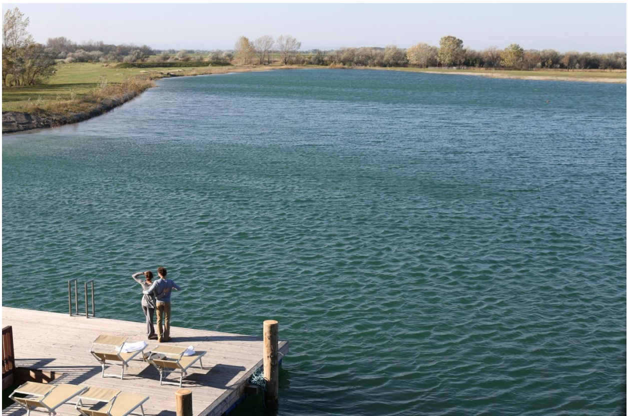
Das neue See-SPA der St. Martins Lodge mit direktem Seezugang.